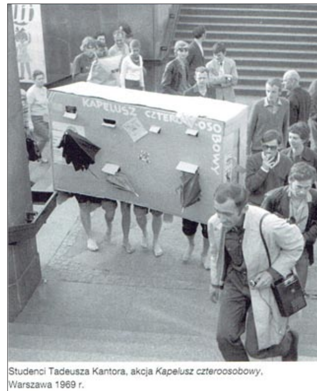
Studenci Tadeusza Kantora, akcja Kapelusz czterosobowy , Warszawa 1969 r.